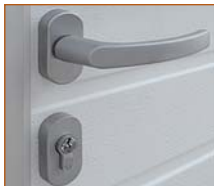
Venkovní madlo se zámkem