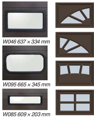
W046 637 x 334 mm