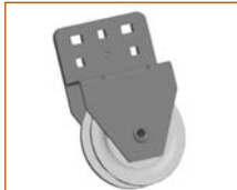
Systém ručního zdvihu HKU1